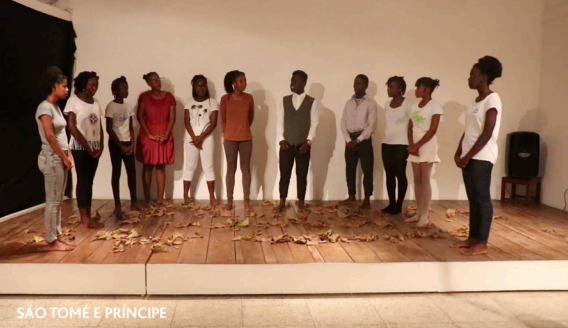
SÃO TOMÉ E PRÍNCIPE